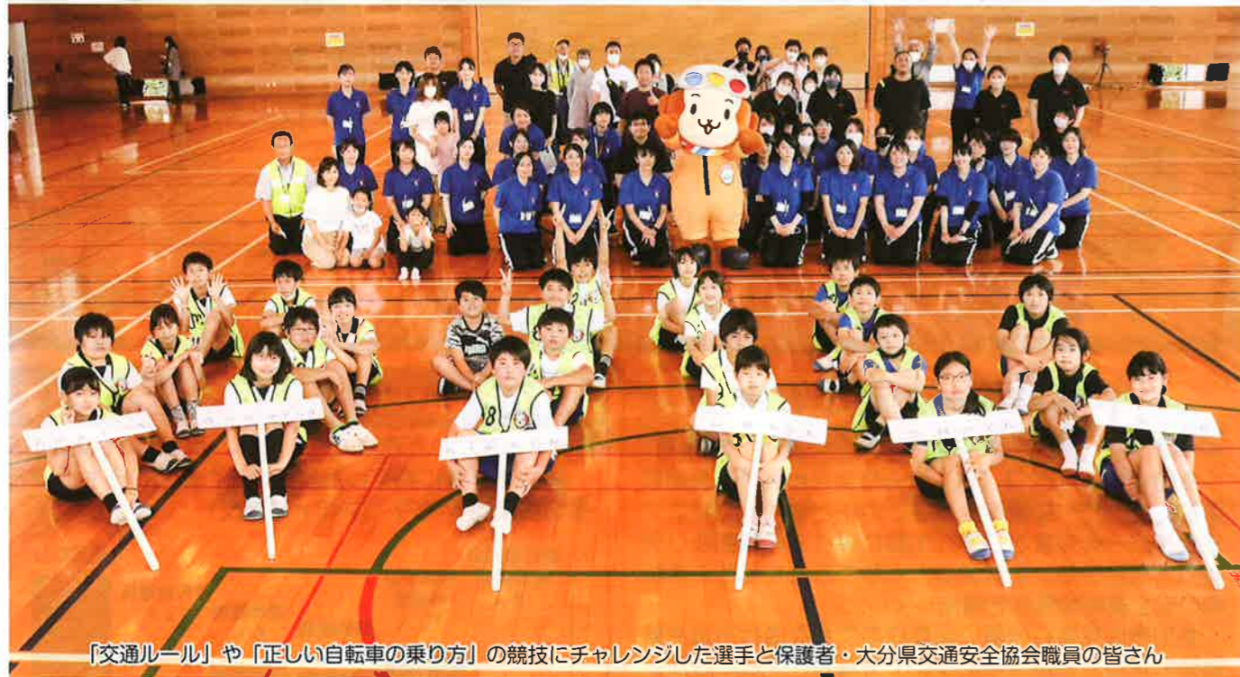
「交通ルール」や「正しい自転車の乗り方」の競技にチャレンジした選手と保護者・大分県交通安全協会職員の皆さん