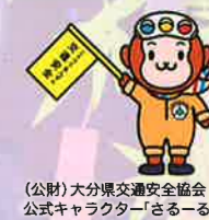
(公財)大分県交通安全協会 公式キャラクター「さるーる」