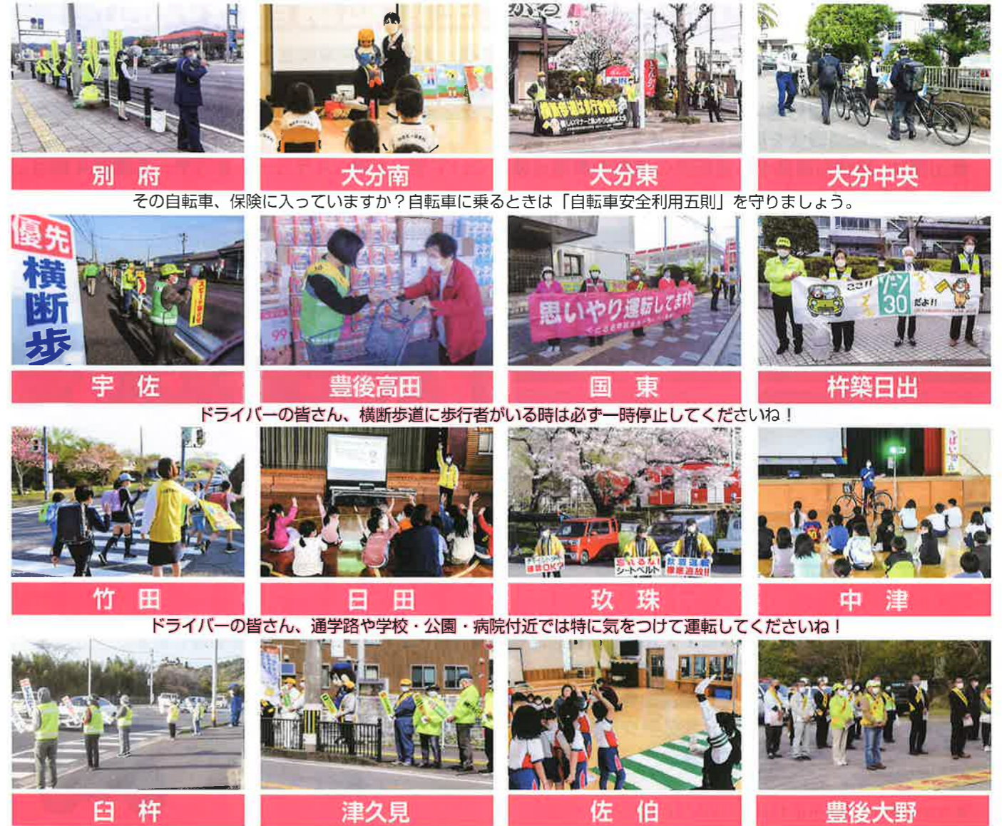
その自転車、保険に入っていますか?自転車に乗るときは「自転車安全利用五則」を守りましょう。